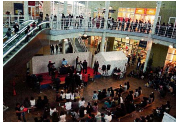
ステージ写真 (イベント実施例)